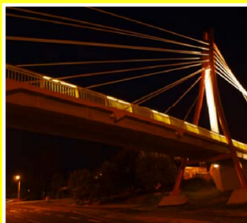
Budowa kładki dla pieszych nad DK 3 w Polkowicach o rozpiętości 6,85 + 49,23 + 4 x 15,80 m